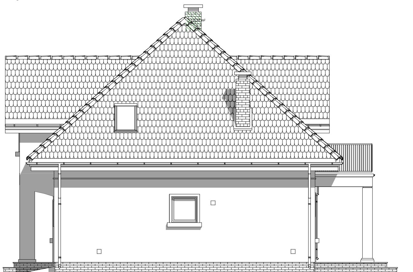
elewacja boczna :