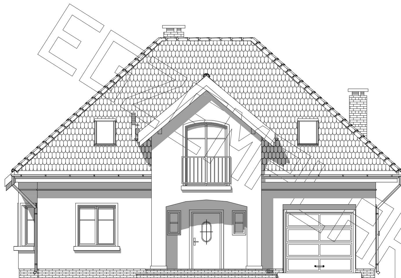
elewacja frontowa :