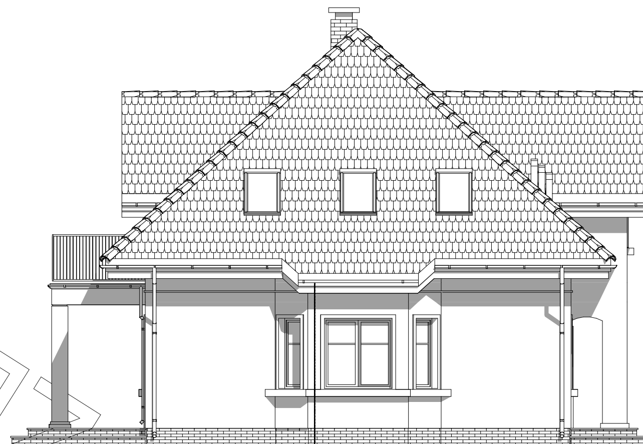
elewacja boczna :