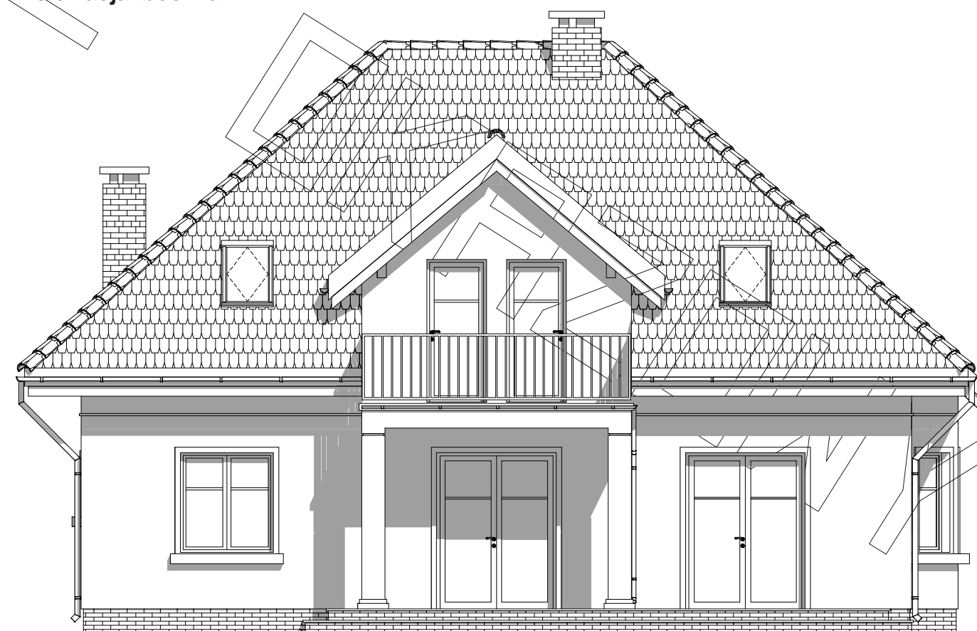
elewacja ogrodowa :