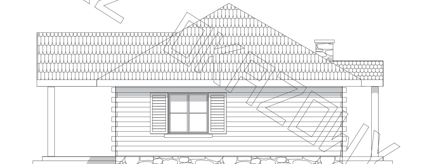
elewacja boczna :