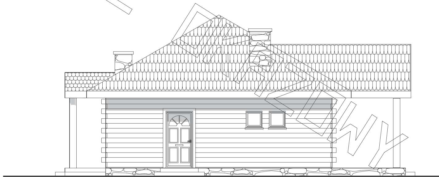
elewacja boczna :