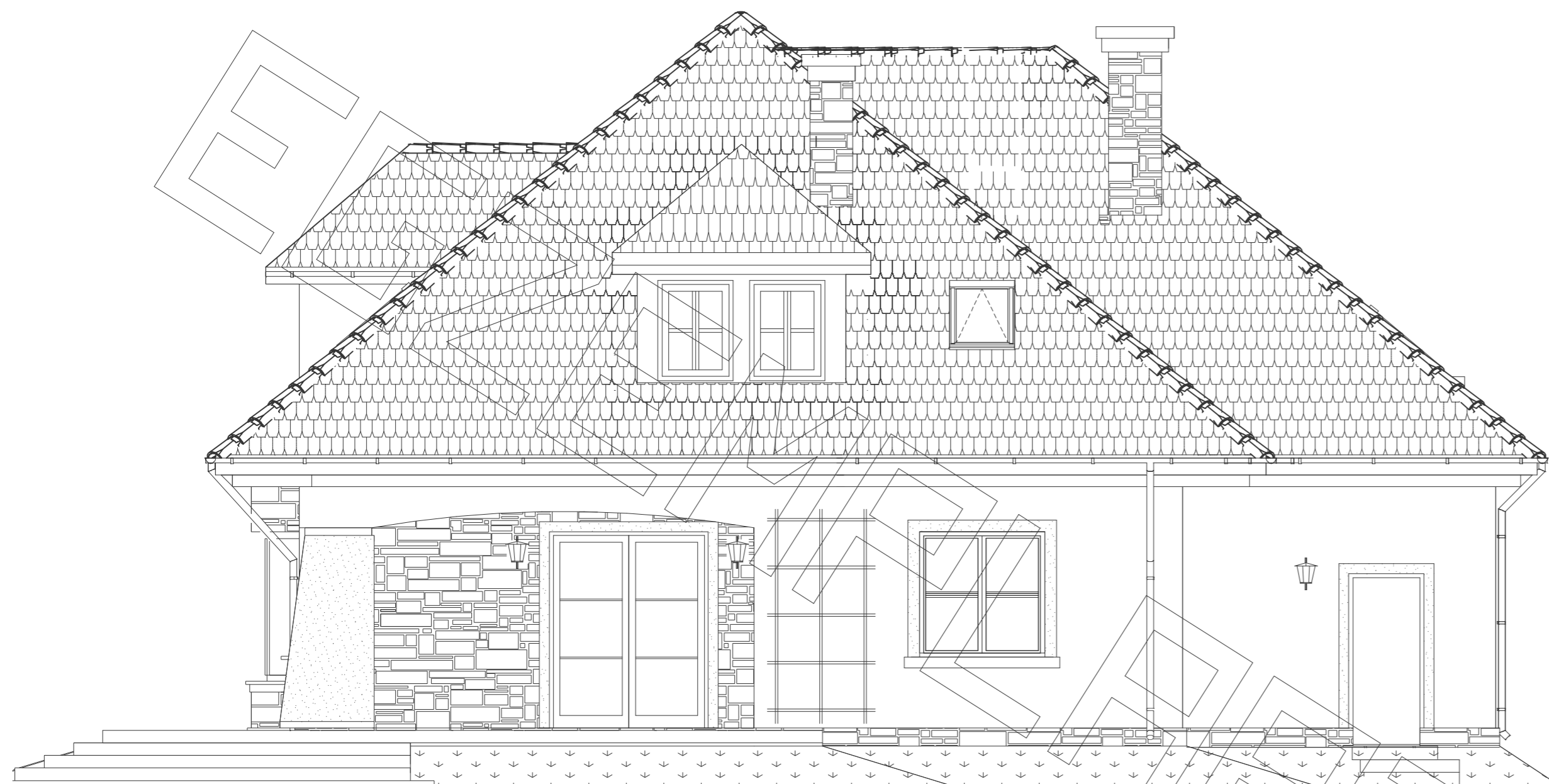
ELEWACJA TYLNA ( OGRODOWA ):