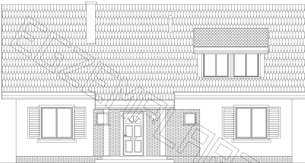
elevacja frontowa :