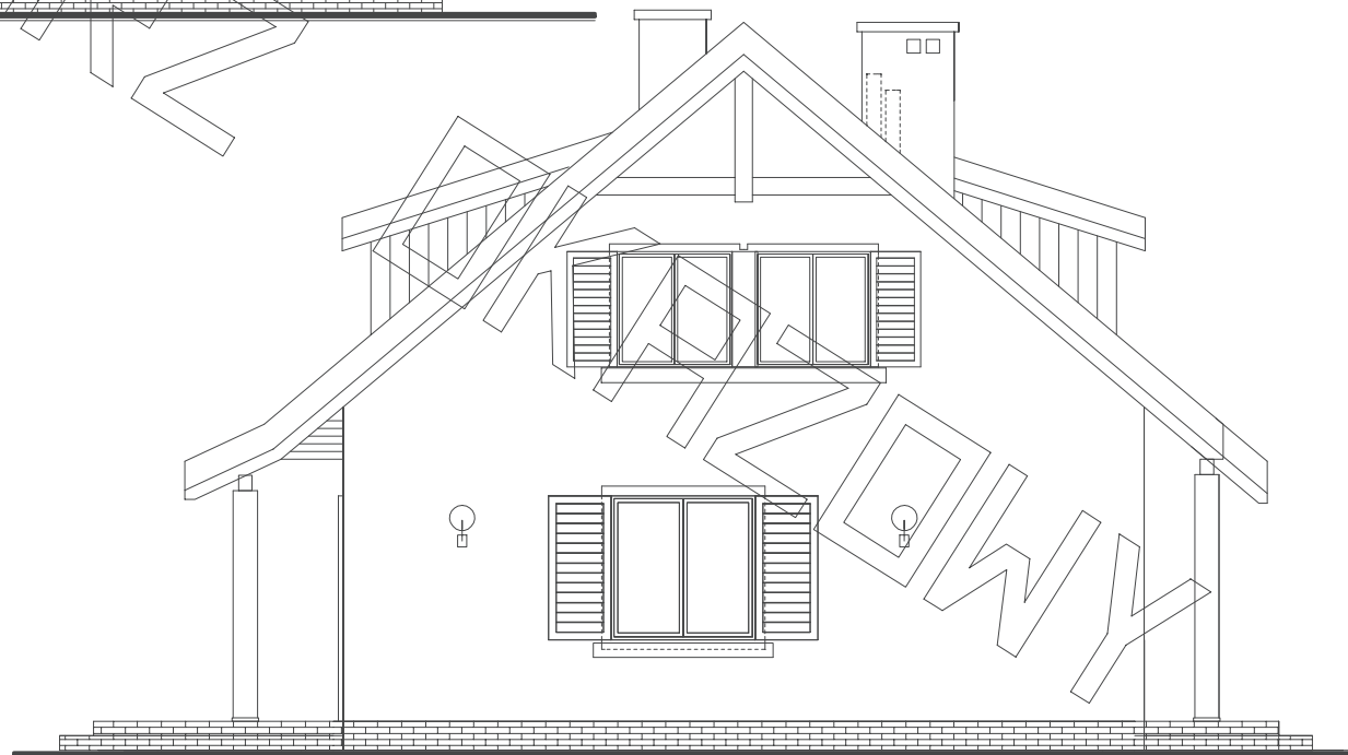
elevacja boczna :