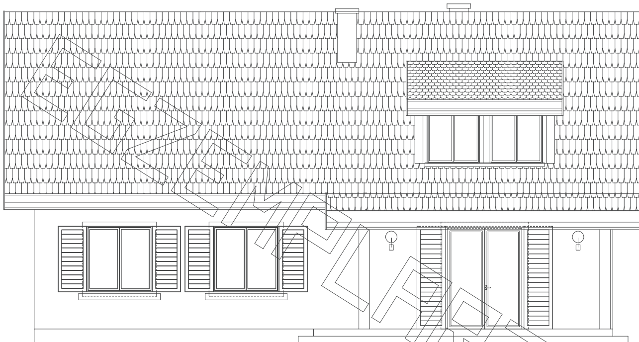
elewacja ogrodowa :